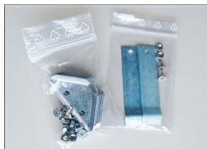
Winkelverbinder und Maueranker werden lose mit dem Winkelrahmen geliefert