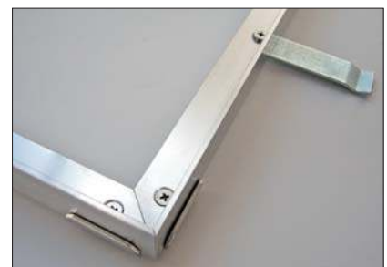
Winkelrahmen mit Eckverbinder und Maueranker (Lieferung erfolgt ohne Montage)