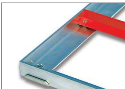
Die roten Winkelprofile dienen als Einbauhilfe bei Rahmen über 2 m Seitenlänge