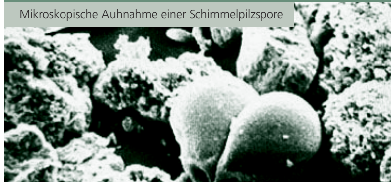
Mikroskopische Aufnahme einer Schimmelpilzspore

Die Sporen von Schimmelpilzen können sich überaus schädlich auf den menschlichen Organismus auswirken. So können beispielsweise bei einer sogenannten „mikrobiellen Eskalation“ Luftbeschwerden und Allergien und in der Folge davon ein Abfall der physischen Leistungsfähigkeit auftreten. Daher sollte der auf einer Silikonfuge auftretende Schimmel so schnell wie möglich entfernt werden. Oder besser noch, er sollte erst gar nicht entstehen.