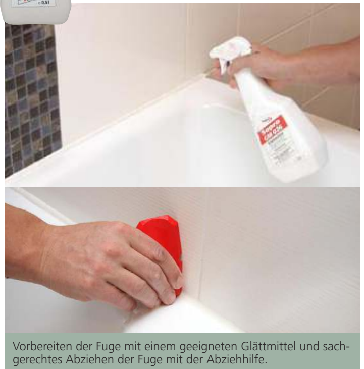
Vorbereiten der Fuge mit einem geeigneten Glättmittel und sachgerechtes Abziehen der Fuge mit der Abziehhilfe.