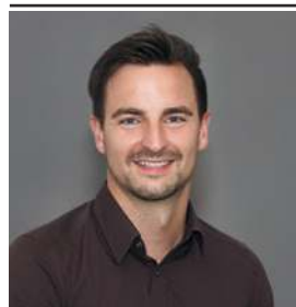
Autor: Benjamin Diensberg Steinmetz- und Steinbildhauermeister Anwendungstechnik der Sopro Bauchemie GmbH