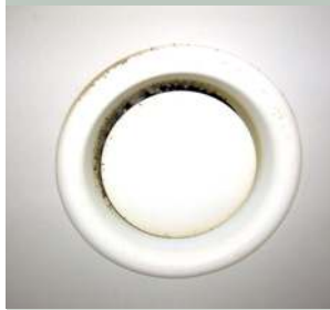
Schimmelbildung am Belüftungssystem