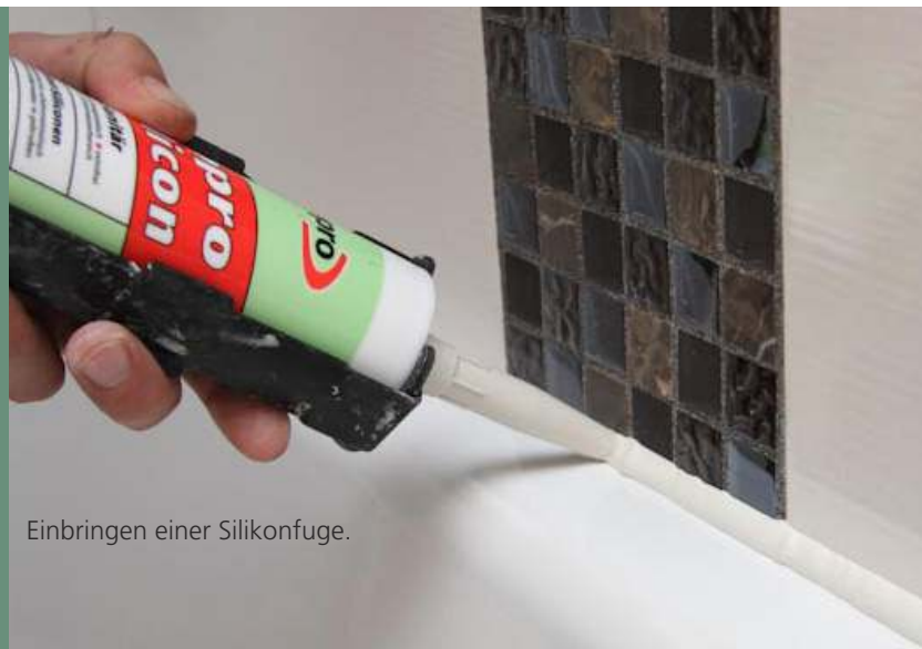
Einbringen einer Silikonfuge.

Eine Wartungsfuge ist mehr oder weniger chemischen, biologischen sowie physikalischen Einflüssen ausgesetzt. Daher muss dieser Dichtstoff in regelmäßigen Zeitabständen überprüft und gegebenenfalls erneuert werden, um weitere und größere Folgeschäden zu vermeiden. Als Verarbeiter sollte man seinen Kunden auf den Sachverhalt grundsätzlich schriftlich hinweisen und eine begrenzte Haftung vereinbaren oder noch besser, einen dauerhaften Wartungsvertrag abschließen.